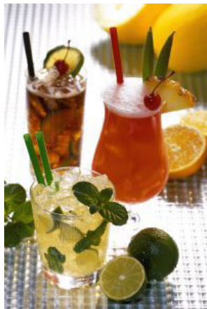
Fruchtige Cocktails werden vorgestellt auf dem Portal www.spirituosen-verband.de

Ob süß, sauer oder sahnig, geschüttelt oder gerührt: Mixgetränke schmecken nicht nur lecker, es macht auch großen Spaß, eigene Kreationen zu zaubern.