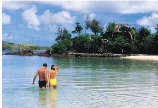
Kristalline Buchten und endlose weiße Sandstrände bieten viele der etwa 330 fijianischen Inseln.

Sogar Business-Meetings oder Mitarbeitertrainings und -incentives der etwas anderen Art werden von professionellen Partnern vor Ort individuell zusammengestellt.