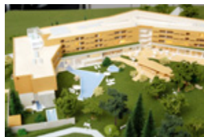
Hier noch im Modell lädt das neue „Carinzia“ jetzt zum Softopening mit 50 Prozent Preisnachlass ein.

ten und 7 Seniorsuiten. Space for Emotions - Exklusives Ambiente und Wohngefühl Raum für Gefühle bedeutet, dass der