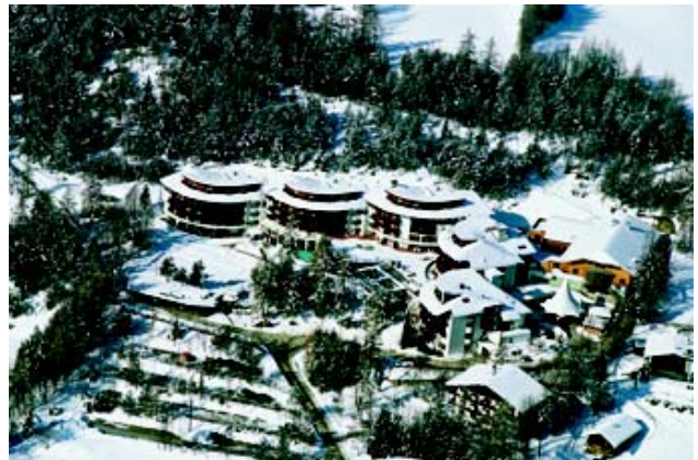
1.200 Meter hoch, im Herzen der Alpen gelegen, ist im 5-Sterne-Hotel der Gast ein König.

Wir erlebten ein Haus mit einem 5-Sterne-Komfort in ungewöhnlich individueller und exklusiver Form. Die Gastgeber verwöhnten uns mit erstklassigem Service sowie mit größter Freundlichkeit und Charme. Sie brachten uns in eine leichte, zwanglose Stimmung, in der wir einige unbeschwertere Tage genießen konnten.