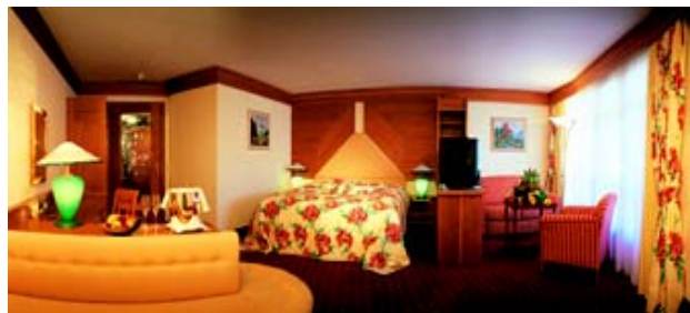
Großzügigkeit ist in jedem Doppelzimmer Trumpf.

Für ein abwechslungsreiches Freizeitprogramm ist auch gesorgt: Panorama Hallenbad, Freibad, Saunen, Dampfgrotte, Whirlpool, Fitnessraum, Aerobicraum mit täglichen Wellfit-Angeboten, Tennishallen- und Freiplätze, Fussballplatz und Beachvolleyball. Nightlife in der Tenne mit täglichen Shows und Disco lassen den Urlaubstag stilvoll ausklingen.