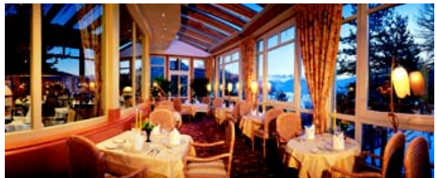
Der Wintergarten im Restaurant Laurin begeistert nicht nur mit einer ausgesuchten Gourmet-Karte, sondern auch mit dem einmaligen Panoramablick.

Hier ist der Gast wirklich noch König - entsprechend bemüht man sich, ihn in den Restaurants zu verwöhnen. Die Buffets und Gourmet-Menüs in den Spezialitätenrestaurants geben dafür den köstlichsten Beweis. Dazu gehörte auch der zünftige Tiroler Abend mit regionalen Spezialitäten in der am hotel-eigenen Gelände befindlichen Enzianhütte.