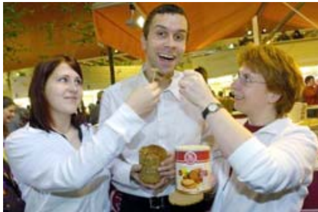
Eine Brot-Neuheit präsentierte Niedersachsen auf der Grünen Woche: das erste Bio-Aktivkeim-Brot Deutschlands mit dem Namen Sympa Korn.

Eine Brot-Neuheit hört auf den Namen Sympa Korn und ist das erste Bio-Aktivkeim-Brot Deutschlands. In ihm steckt pure Kraft der Keimlinge. Das Geheimnis liegt in der Backart, es wird aus keimaktivierten Getreide statt herkömmlichen Mehl gebacken. Reich an Vitaminen, Fasern, Proteinen, Mineralstoffen und Spurenelementen ist es besonders wertvoll. Mit viel Ballaststoffen und ungesättigten Fettsäuren trägt es zur gesundheitsbewussten Ernährung bei.