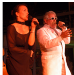
Mitternachtsshow mit „Rest of Best“.

tion im Anschluss durch Gräfin zu Rantzau vom Auktionshaus Christie's versteigert. Die stolze Spendensumme von 35.600,- Euro ging zu Gunsten der SOS-Kinderdörfer.