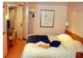
Die Suiten auf der Yacht stehen denen im Grandhotel an Land um nichts nach.

Am Abend wurde „BIG EUROPA“ mit dem Korkenzug einer der Großflaschen feierlich eröffnet. Deutsche, österreichische und italienische Win-