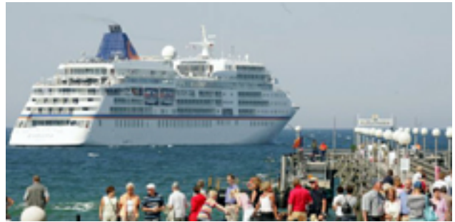
Die EUROPA vor der Seebrücke von Heiligendamm war eine Attraktion für die Schaulustigen.

Eine besondere Weltpremiere gab es dabei unter dem Namen „BIG EUROPA“. Der Name war dabei wörtlich zu nehmen: Acht renommierte Winzer Europas haben ihre Spitzenweine in Flaschen mit einem weltweit einzigartigen Fassungsvermögen von 27 Litern abgefüllt.