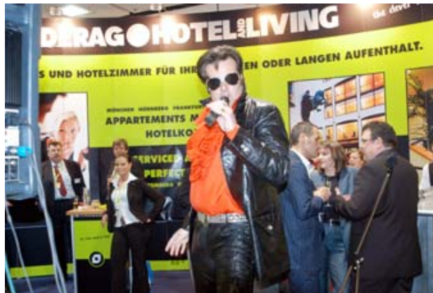
Viele Aussteller lockten bei der ITB mit Standpartys. Hier hatte die Hotelkette DERAG (u.a. „Russischer Hof in Weimar) sogar Elvis aufgeboten.

„Angesichts der verbesserten konjunkturellen Entwicklung rechnen wir mit steigenden privaten Konsumausgaben“, erläutert Hans-Peter Muntzke, Tourismus-Experte der Bank. Zudem gebe es einen gewissen Nachholeffekt, nachdem drei Jahre hintereinander weniger gereist wurde.