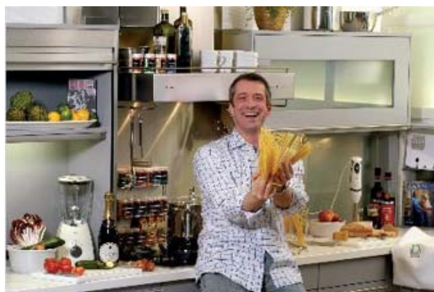
Starkoch Alexander Herrmann drückt den Teilnehmern des Cooking Cups 2004 die Daumen.

Der Hauptpreis ist eine Kreuzfahrt durchs italienische Mittelmeer auf der Luxus-Yacht SeaDream - sieben Tage Genuss mit Champagner, lukullischen Köstlichkeiten und abwechslungsreichen Landgängen!