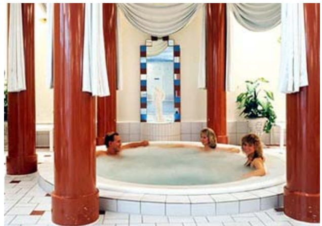
Relaxen im hoteleigenen Fitnesscenter des Dorint Seehotel Überfahrt am Tegernsee.

Nur etwa 50 Kilometer von München entfernt, unmittelbar am Südufer des Tegernsees, liegt das traditionsreiche Dorint Seehotel Überfahrt. Sein exklusives Interieur und der einzigartige Komfort machen das Fünf-Sterne-Hotel zu einem Ort des Wohlfühlens und der Entspannung. Ganz gleich, ob man auf dem eigenen Balkon die gute Luft und den herrlichen Blick auf die bayerischen Berge genießt oder zum Baden, Pflegen und Relaxen den mondänen Wellnessbereich oder das hoteleigene Fitnesscenter besucht, hier findet jeder die Erholungsmöglichkeit, die er sucht.