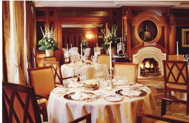
Gourmet Restaurant „Lorenz Adlon“ (Siehe S. 2).

Mit einem Erweiterungsbau erhält das traditionsreiche Hotel Adlon am Pariser Platz in Berlin jetzt zusätzlich 69 neue Hotelzimmer, davon 21 Suiten. Der moderne Bau auf dem über 1.000 Quadratmeter großen Eckgrundstück Wilhelmstraße/ Behrenstraße grenzt an die Britische Botschaft und ist direkt mit dem Adlon verbunden. Damit bietet Kempinski jetzt 401 Zimmer an.