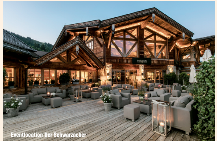
Eventlocation Der Schwarzacher

Wer glaubt, dass die passionierte Geschäftsfrau mit der Leitung der Unterschwarzach Betriebe ausgiebig beschäftigt ist, liegt vollkommen richtig. Ihre Handschrift ist im gesamten Haus spürbar. Mit einer klugen Mischung aus Designklassikern, heimischen Mate-