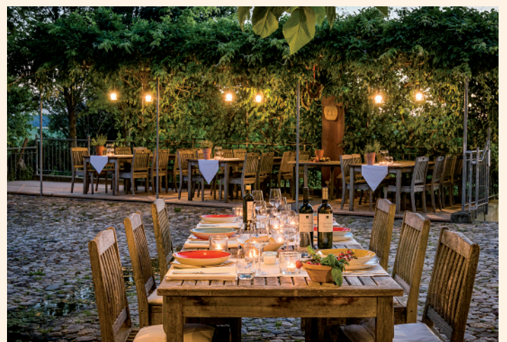
Terrasse Hofgut Hafnerleiten