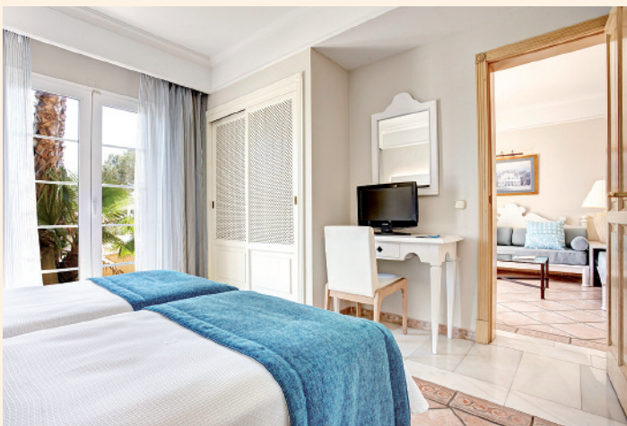
Die Apartments des Grupotel Playa Club auf Menorca sind jeweils ausgestattet mit Küche und zusätzlichem Schlafzimmer.