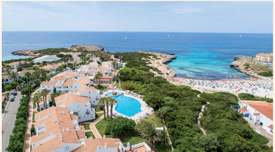
An Menorcas Südküste reihen sich weiße Sandstrände wie die Cala'n Bosch, an die das Grupotel Aldea Cala'n Bosch angrenzt.