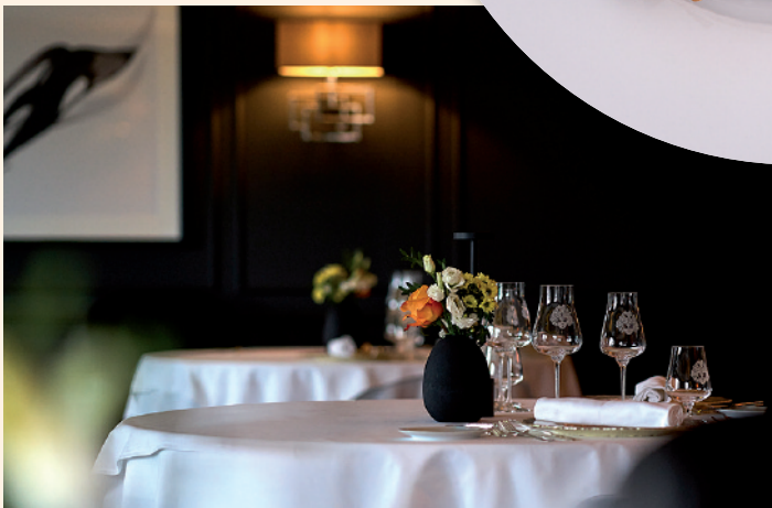
Oswalds Gourmetstube