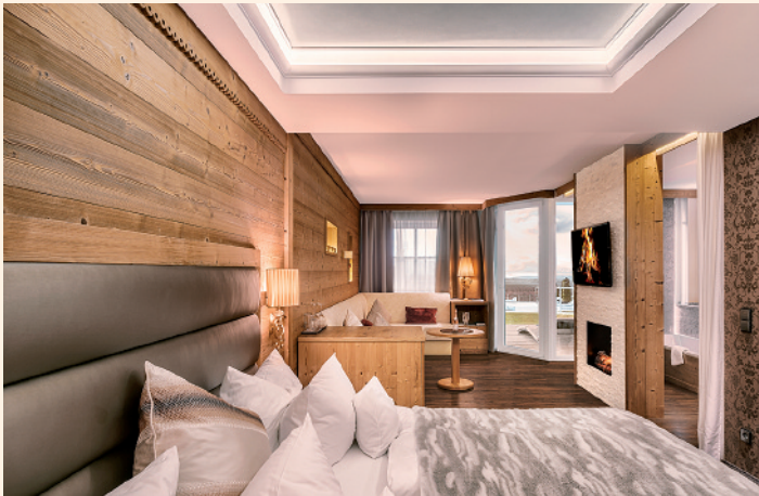
Zimmer Kuschelsuite (links) und Zimmer Storchennest