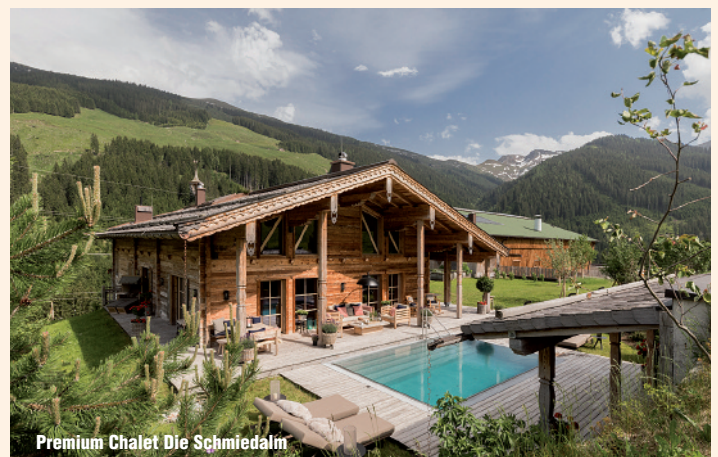
Premium Chalet Die Schmiedalm